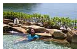
薬草歳時記露店風呂 季節の薬草が入っている