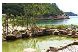
胎内風呂 海水より濃い塩水風呂