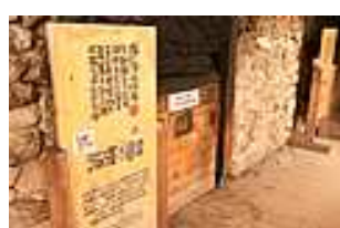
窟蒸し風呂 蓬や枇杷を炊き上げる